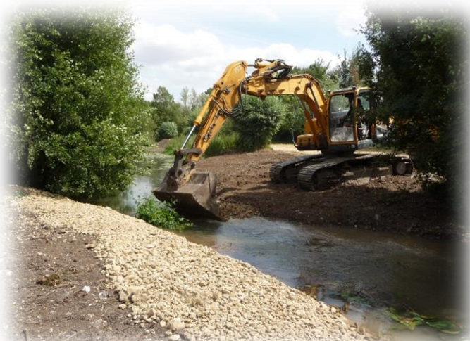
Apport de pierres dans le lit du cours d'eau