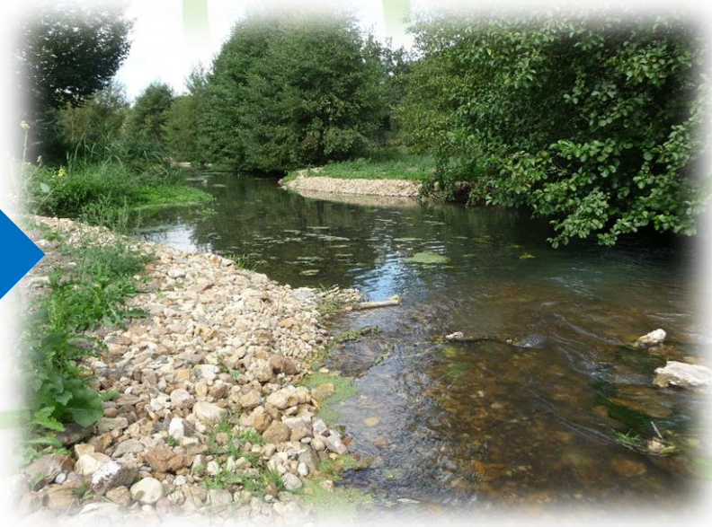
Resserrement du lit de l'Echandon à sa largeur naturelle, alternance d'écoulements