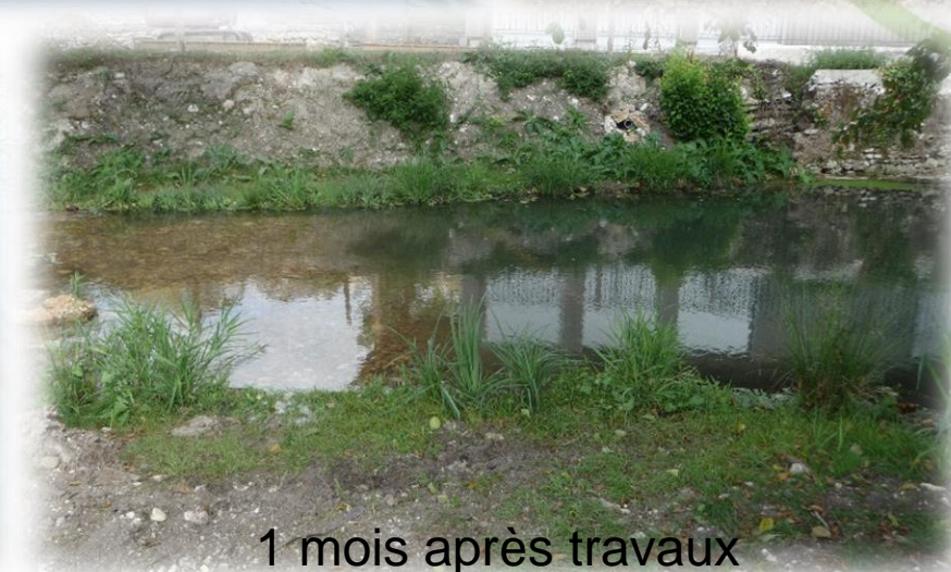
1 mois après travaux