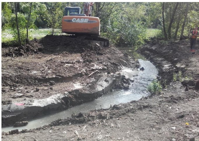
3- Mise en eau des méandres