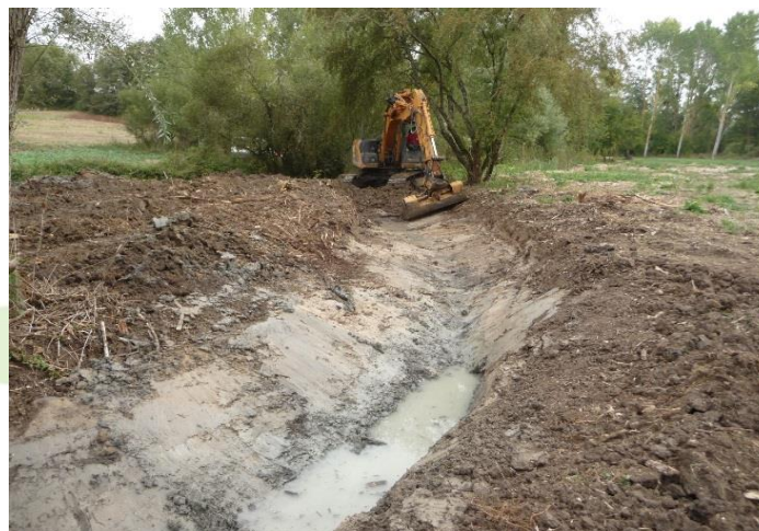
2- Création des méandres