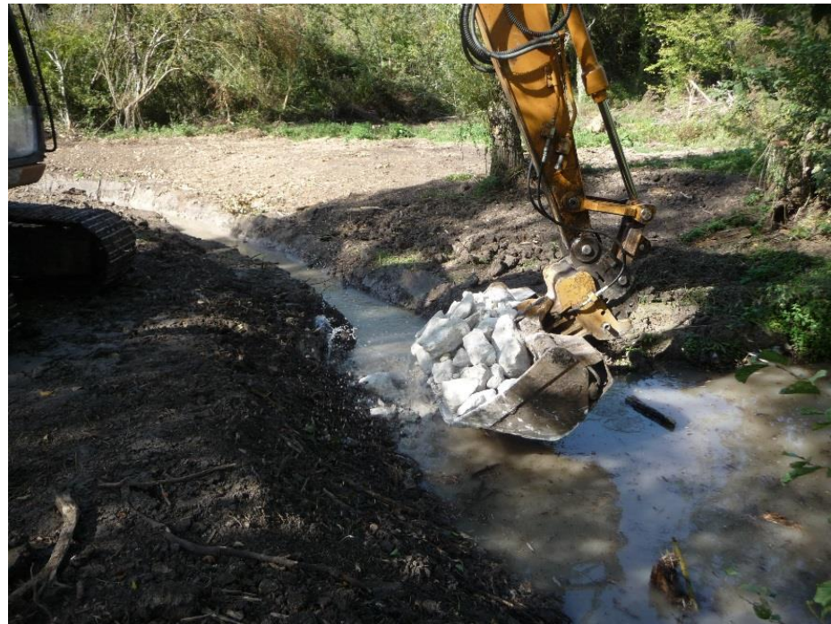
5- Mise en place de blocs et de cailloux