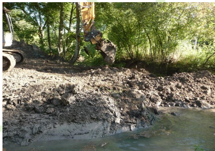
4- Comblement de l'ancien lit