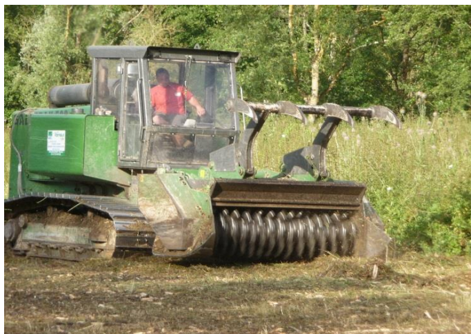
1- Broyage de souches de peupliers et de la végétation