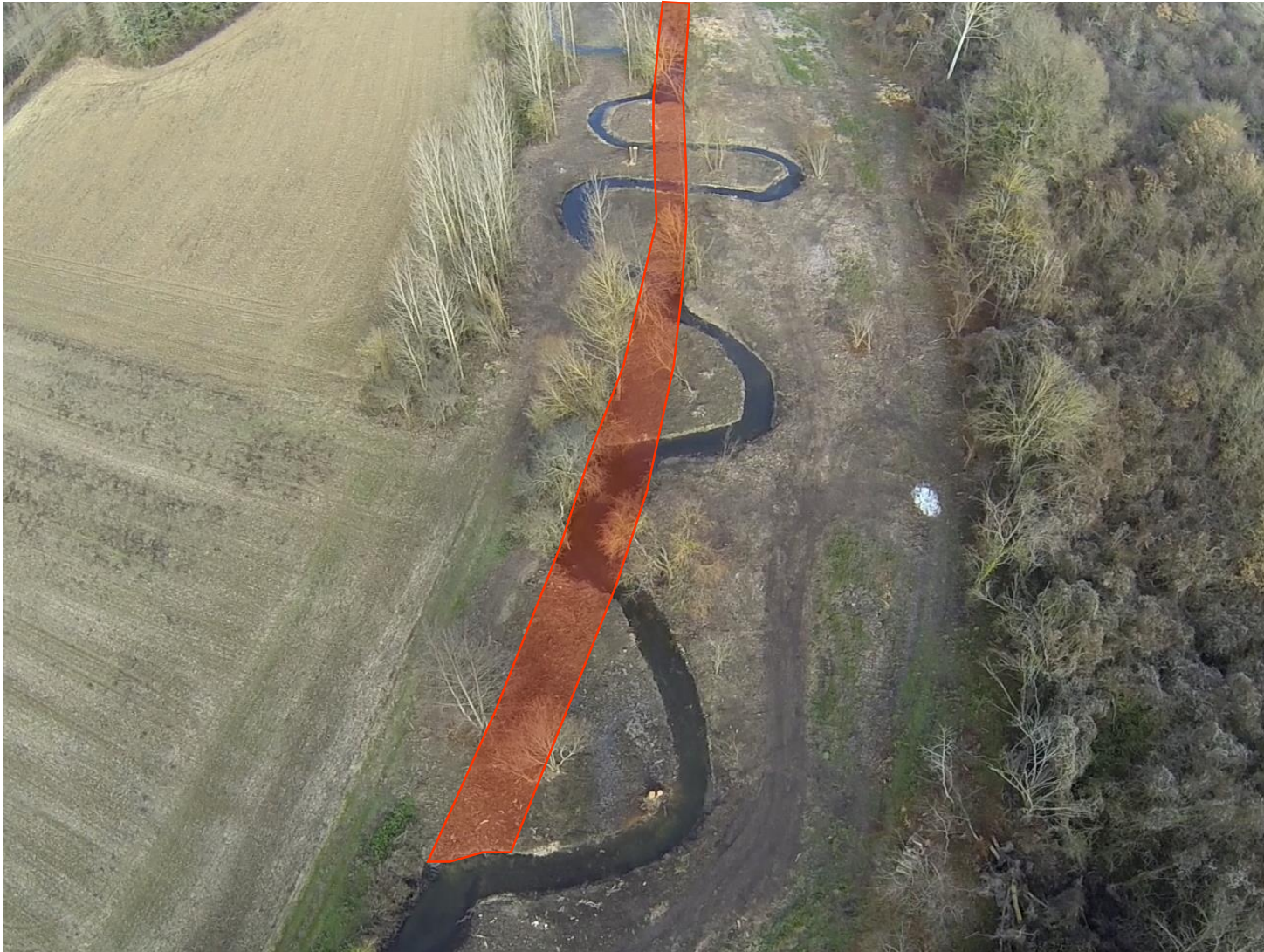
En rouge : Cours d'eau avant travaux